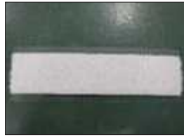
サイドカバー面ファスナー