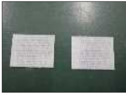
便器面ファスナー