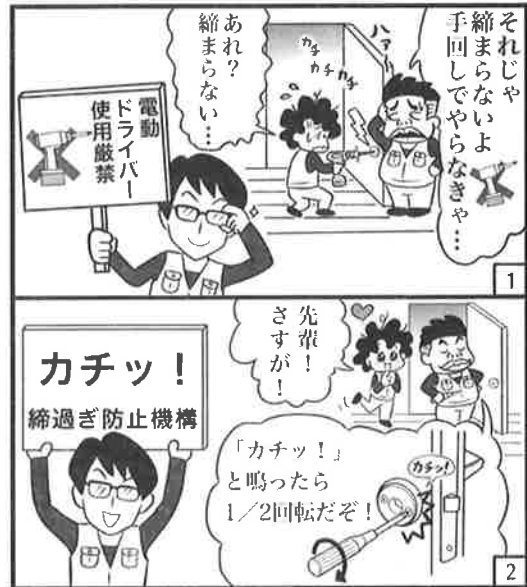
このマンガはフィクションです。 実在の人物や団体などとは関係ありません。