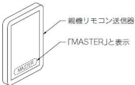
親機リモコン送信器の裏面